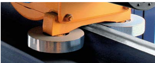
Führungsrollen an der oberen Kranbahn