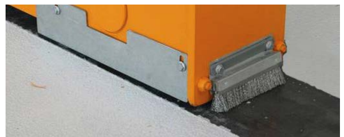
Bodenrollen ohne Führungsschiene